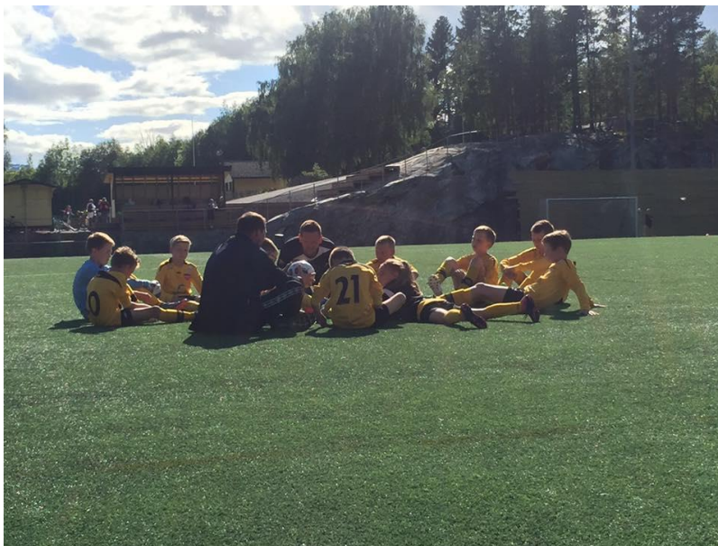
Hafslo G11 ladar opp til bortekamp mot Syril 14.juni 2017