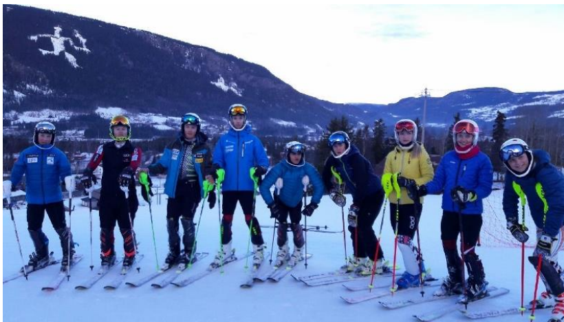
Sogn-og Fjordane alpinistar frå fleire klubbar på Hovudlandsrenn