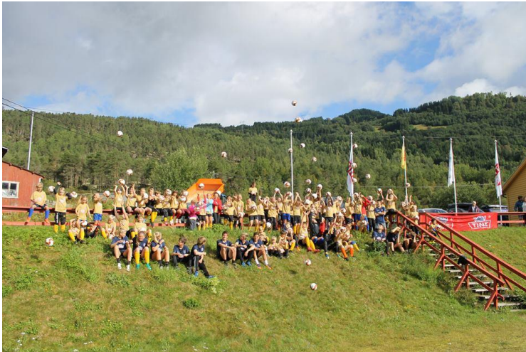
Åpningsdag av Tine Fotballskule Hafslo 2017 – for 10.gong!