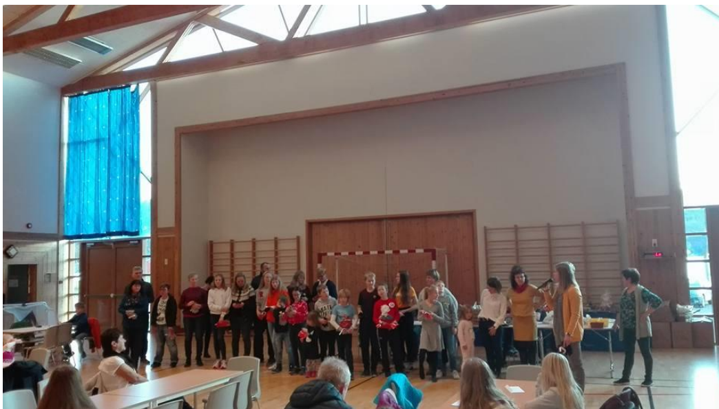
Velfortente premiar til årets TRIMMIAN-deltakarar på Haustmarknaden 5.november!

Nokre av bøkene frå 2016 er no skifta ut og nokre nye bøker er på plass. Røymstølen er tilbake, heilt nye er Nyre (vidare på vegen til Måsaviki) og «Ysta Neset» (på veg mot Legene i Solvorn).