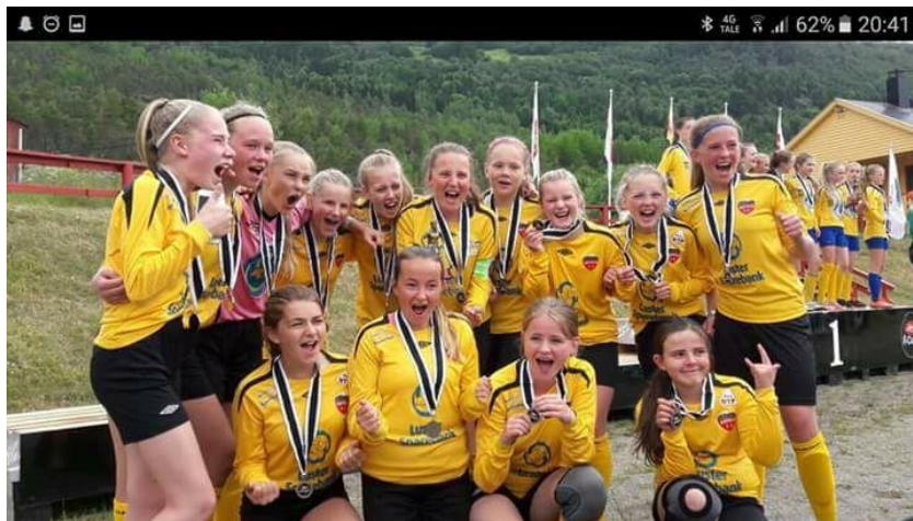
Jublende sølvjenter etter at Hafslo J13/14 tok 2.plass i A-sluttspillet under Lerum Cup 2017

Det låg an til låg deltaking frå Hafslo pga. at den høge deltakaravgifta som er på Lerum Cup. (pris B-kort 820,- per deltakar + 1300,- lagsavgift) Etter avtale med hovedstyret, så vart eigenandelen satt til 300,-.