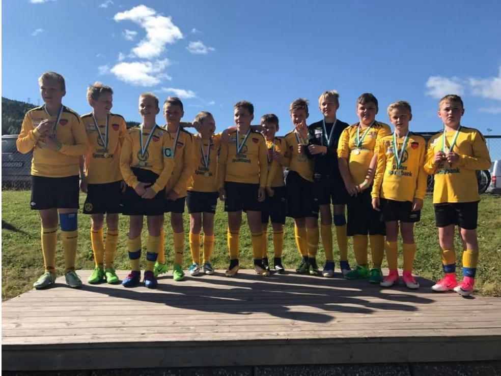
Velfortent premie til Hafslo G12 under Ål Cup 2017

-EatMoveSleep (Sogndal oktober 2017): Saman med G06 stilte G05 to 7ar-lag, og deltok for siste gong på denne turneringa (til neste år er G05-gutane for gamle til å delta). Det har vore mykje rart når det gjeld kampoppsett i løpet av dei åra vi har deltatt på denne turneringa, men dei to siste åra har vore særskilt bra. Det var ikkje sluttspel, men laga spelte mykje flott fotball, og hausta honnør for det!