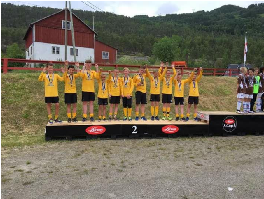
Flott 2.plass til Hafslo G13/14 i B-sluttspillet under Lerum Cup 2017