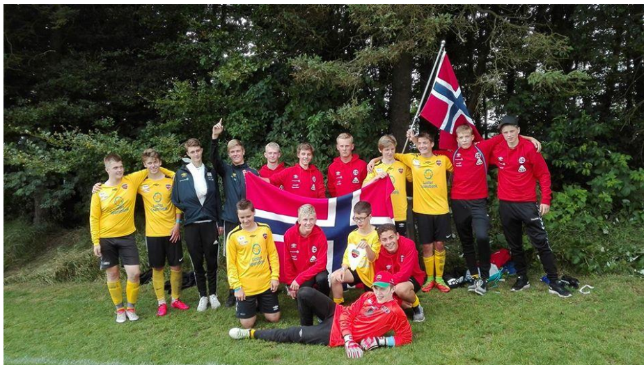
Godt nøygde Hafslo G15/16/17-gutar etter siste kamp under Vildbjerg Cup 2017