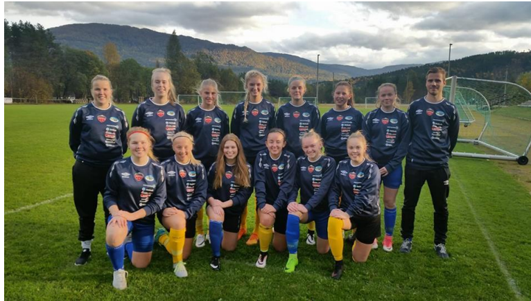
Samarbeidslag mellom Hafslo IL og IL Bjørn i klasse J15/16/17

J15/17 har samarbeida med Bjørn. Dette har vore eit kjempeflott samarbeid, som har gitt spelarane mykje både på og utanfor bana. Seks 15-åringar og to 16-åringar frå Hafslo har vore med denne sesongen.