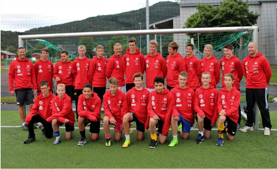
Hafslo G13/14 og Hafslo G15/16/17 før avreise til Vildbjerg Cup 2017