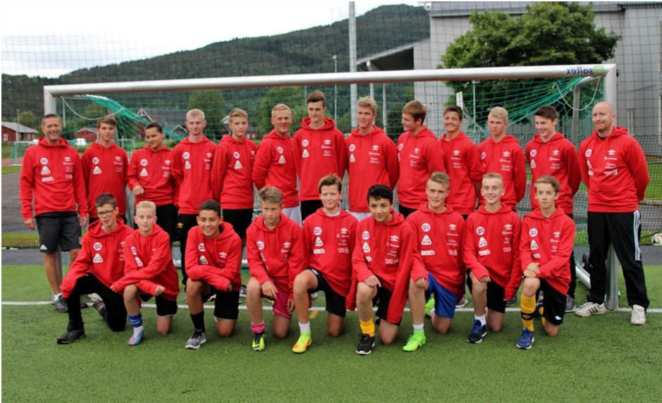
Hafslo G13/14 og Hafslo G15/16/17 før avreise til Vildbjerg Cup 2017