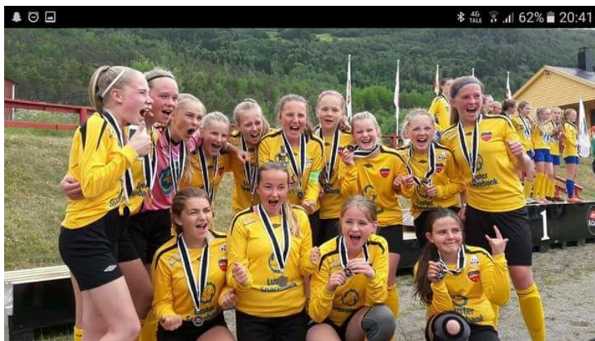
Jublende sølvjenter etter at Hafslo J13/14 tok 2.plass i A-sluttspillet under Lerum Cup 2017

Det låg an til låg deltaking frå Hafslo pga. at den høge deltakaravgifta som er på Lerum Cup. (pris B-kort 820,- per deltakar + 1300,- lagsavgift) Etter avtale med hovedstyret, så vart eigenandelen satt til 300,-.