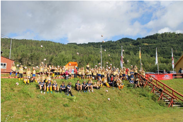
Åpningsdag av Tine Fotballskule Hafslo 2017 – for 10.gong!