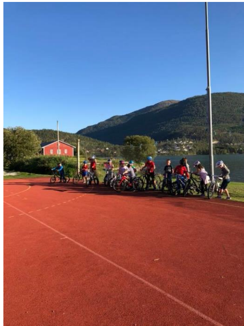
Sykkelaktivitet ved skulen