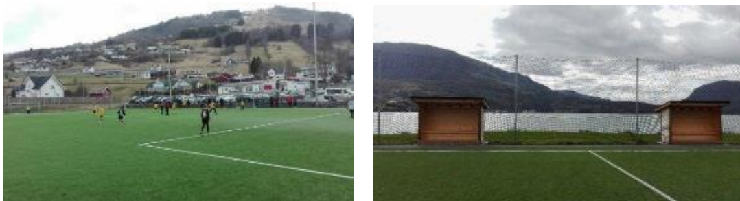
Seriekamp på kunstgrasbana 25. april og innbytarbenkar på plass i august.

Fotballgruppa bestilte innbytarbenkar frå yrkeslinja ved Sogndal vidaregåande skule våren 2018, og i august kom desse på plass på kunstgrasbana. Takk til alle som bidrog med dugnad i form av transport, materialar, støyning og montering av innbytarbenkane. Dette er ei flott oppgradering av fasilitetane på kunstgrasbana, og kjem godt med for lag og spelarar som spelar kampar på kunstgrasbana når vêrtilhøva ikkje er dei beste.