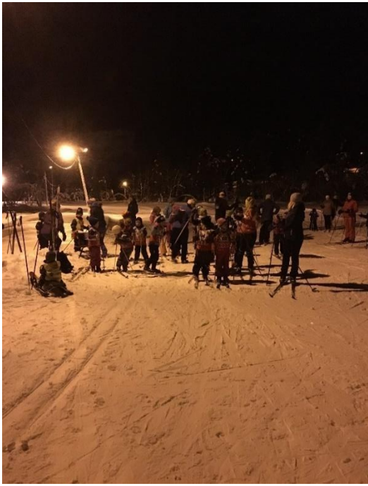
Skileik på Heggmyrane