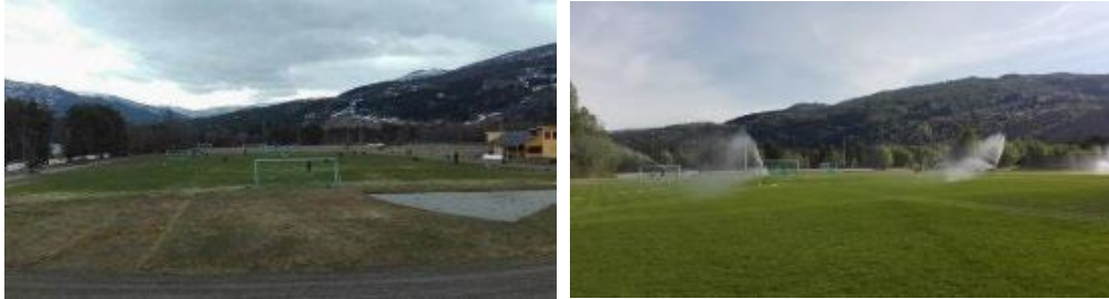
Moane 3. mai og 2. juni – flotte forhold vårsesongen 2018!

Sjølv om grasbana må takast tidlegare i bruk enn ønskjeleg for å få avvikla seriekampar, gjekk det likevel svært bra vårsesongen 2018. Som i fjor vart dei første heimekampane i terminlista bytte til bortekampar. Det vart likevel tidleg gode forhold på grasbana i Moane, og godt vedlikehald med gjødsling, regelmessig vatning og fornuftig grasklypping sørja for ei flott grasmatte og gode speleforhold gjennom heile vårsesongen. Det var også gode speleforhold på grasbana under Lerum Cup, og bana klarte seg godt gjennom heile turneringa.