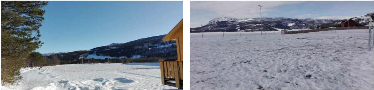
Moane og kunstgrasbana 2. april 2018

Etter ein snørik vinter, kom våren raskt når den først kom i 2018. Det var mykje snø både i Moane og på kunstgrasbana i byrjinga av april. Det hjelpte godt på snøsmeltinga med om lag 20 sekkar blomsterjord på snøen i Moane og om lag 100 liter gummigranulat på kunstgrasbana.