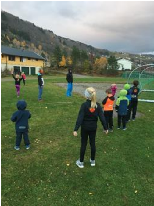
Friidrett i Moane