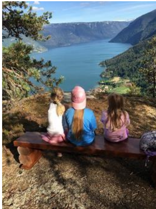
Tur til Huarplassen