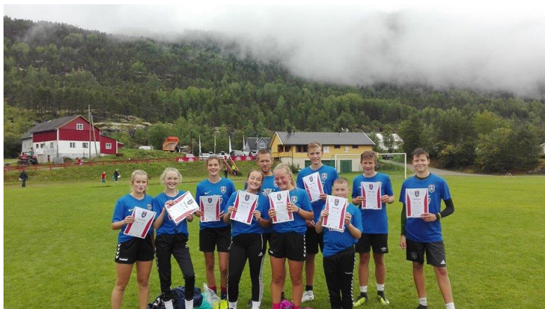
Flinke instruktører med velfortente diplomar etter strålende innsats på Tine fotballskule!