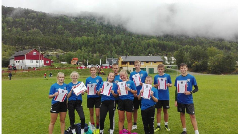
Flinke instruktører med velfortente diplomar etter strålande innsats på Tine fotballskule!