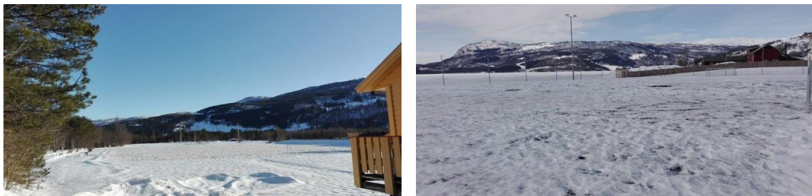
Moane og kunstgrasbana 2. april 2018

Etter ein snørik vinter, kom våren raskt når den først kom i 2018. Det var mykje snø både i Moane og på kunstgrasbana i byrjinga av april. Det hjalp godt på snøsmeltinga med om lag 20 sekkar blomsterjord på snøen i Moane og om lag 100 liter gummigranulat på kunstgrasbana.