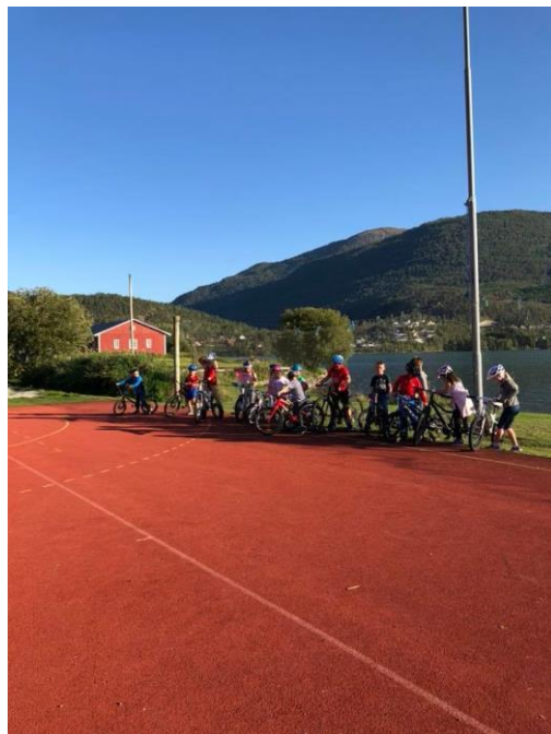
Sykkelaktivitet ved skulen